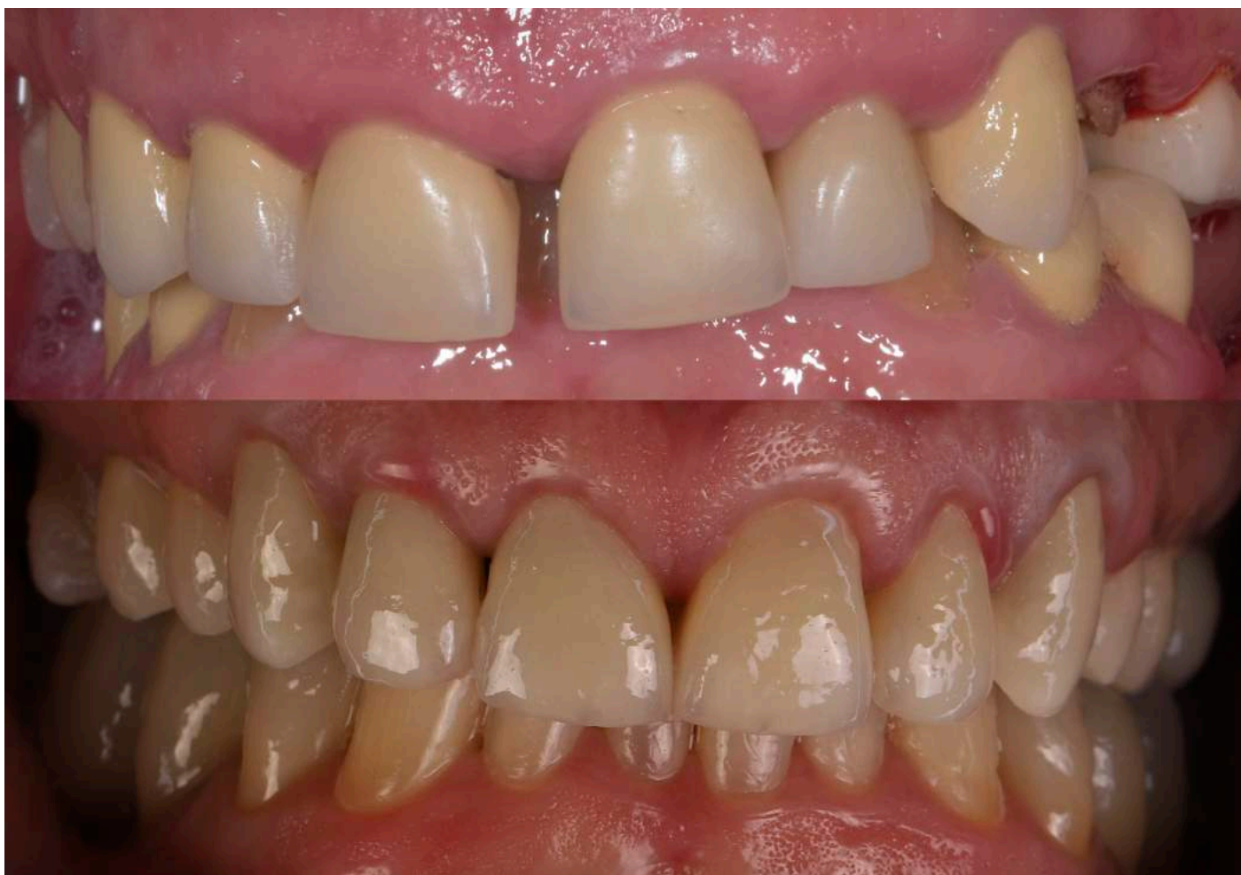
Slika zgoraj: Pred posegom; Slika spodaj: po posegu